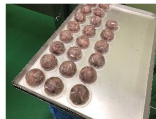
うまかあじたたき